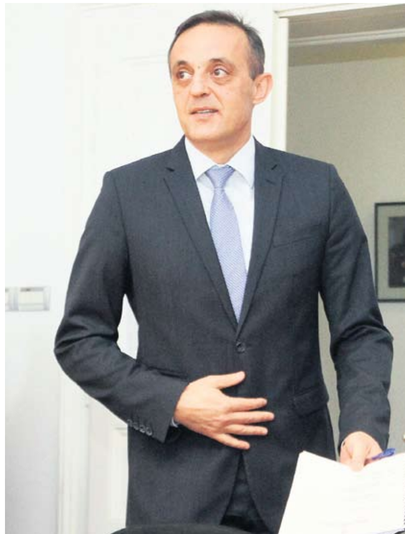
Tihomir Jakovina, ministar poljoprivrede

U operacijama 4.1.1 i 4.1.2 najveći broj prijava, gotovo 80 posto je od obiteljskih poljoprivrednih gospodarstava, ostatak otpada na trgovačka društva, obrte, zadruge. U operaciji 4.1.1. – namijenjenoj ulaganjima u poljoprivredna gospodarstva, najveći broj prijava, njih 880 odnosi se na ulaganja u poljoprivrednu mehanizaciju i opremu, 103 u izgradnju objekata, a 124 prijave su za podizanje novih nasada. Očekivano najveći broj prijava za poljoprivrednu mehanizaciju i opremu na tragu je naših predviđanja, no upravo zbog toliko broja zahtjeva ozbiljno razmišljamo da na nekom od sljedećih natječaja isključimo mogućnost nabavke isključivo poljoprivredne mehanizacije. U operaciji 4.2.1. prevladavaju ulaganja trgovačkih društava uz poneki obrt i poljoprivrednu zadrugu.